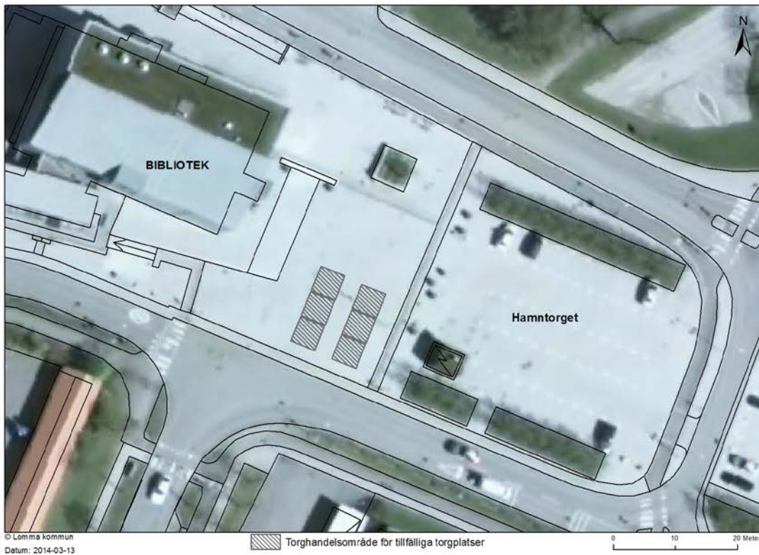
Hamntorget i Lomma.