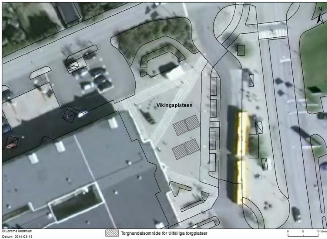
Vikingaplatsen i Bjärred.