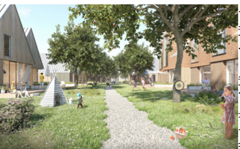
Illustration: Arkitema Architects