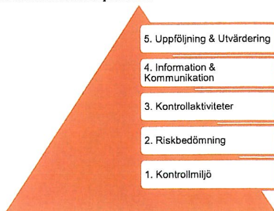
Figur 2. COSO-modellen och dess fem komponenter.

Nedan beskrivs COSO-modellens olika komponenter.