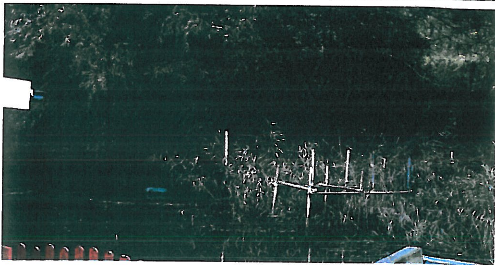
Vid brygga C, rör söder om bryggan tas bort