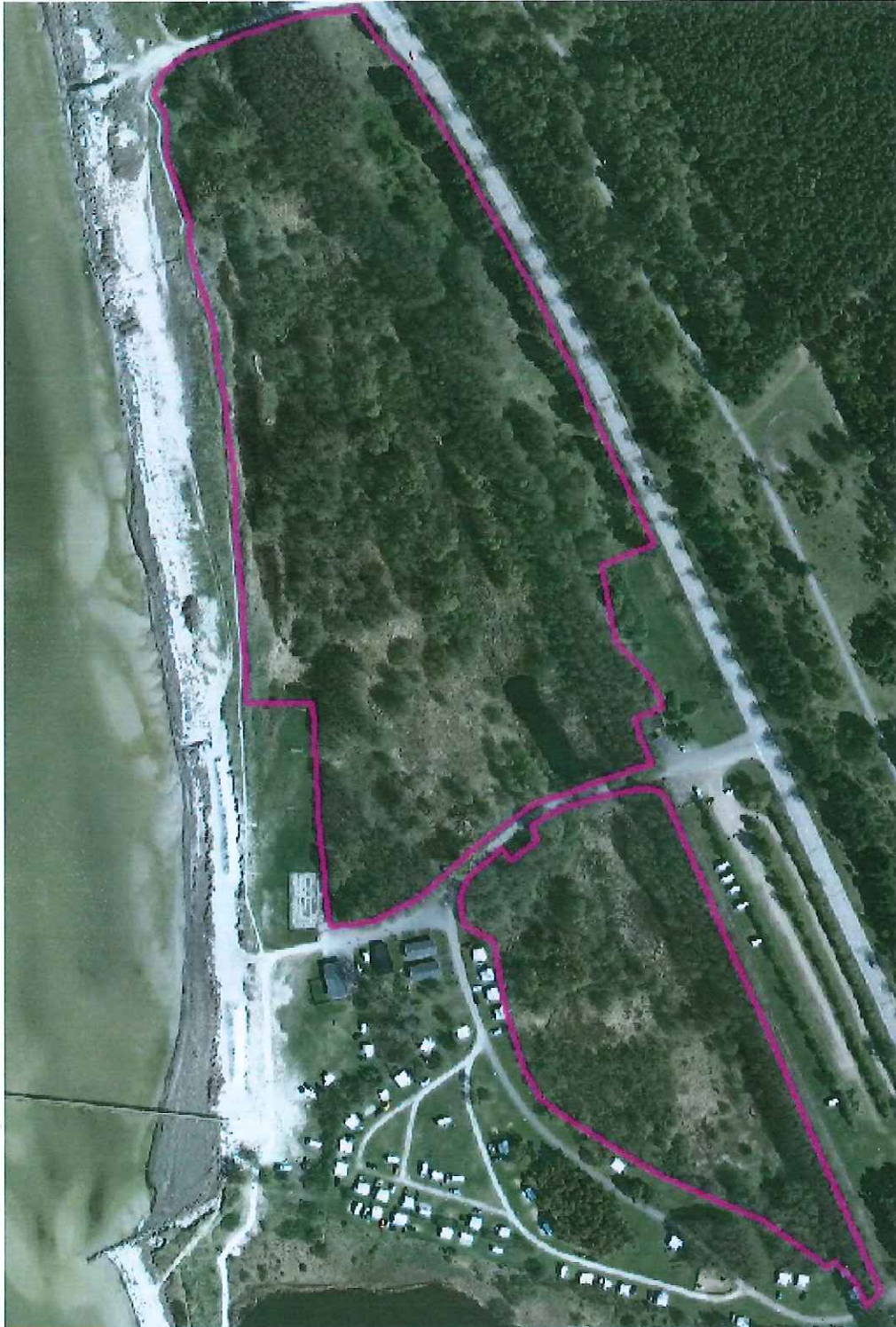
Alkärret i Haboljung, naturreservatets avgränsning