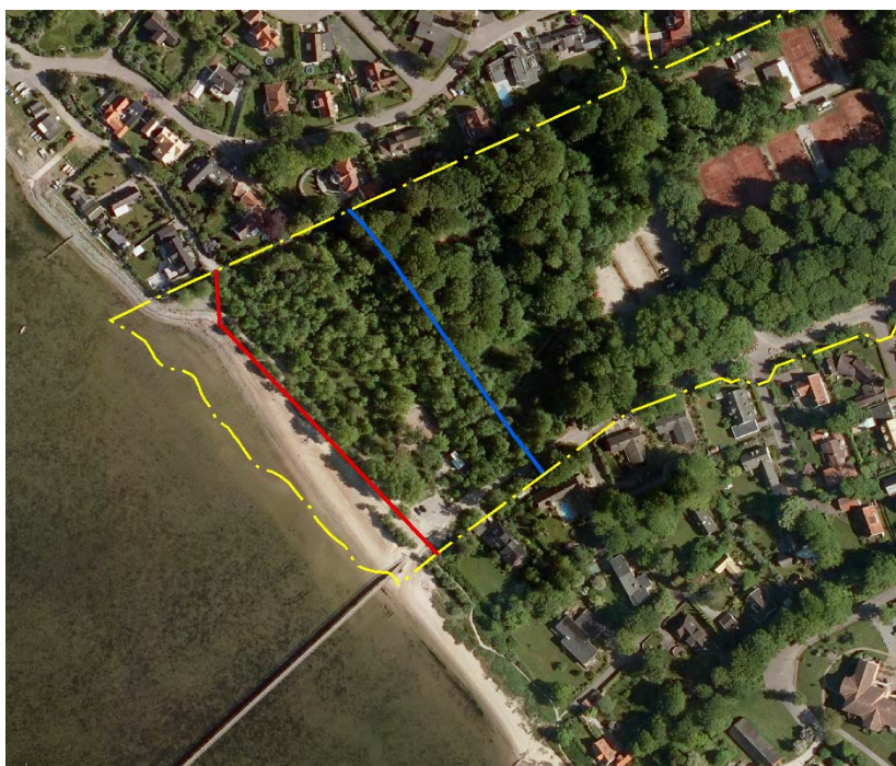
Röd linje visar befintlig strandskyddslinje och blå linje visar ny strandskyddslinje. Gul linje är planområdesgräns.

Strandskydd återinträder vid ny planprövning. Strandskyddet avses inte upphävas.