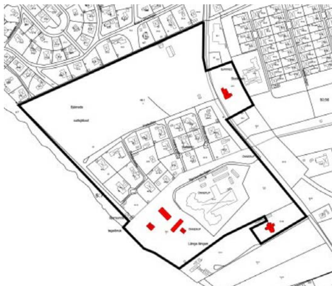
Utdrag ur Lomma kommuns kulturmiljöprogram.

Byggnaden redovisas både som kulturhistoriskt värdefull och bevarandevärd i kulturmiljöprogrammet och bör skyddas mot rivning. Byggnaden har därför åsatts varsamhetsbestämmelse och rivningsförbud i enlighet med 4 kap 16 § PBL (plan- och bygglagen).