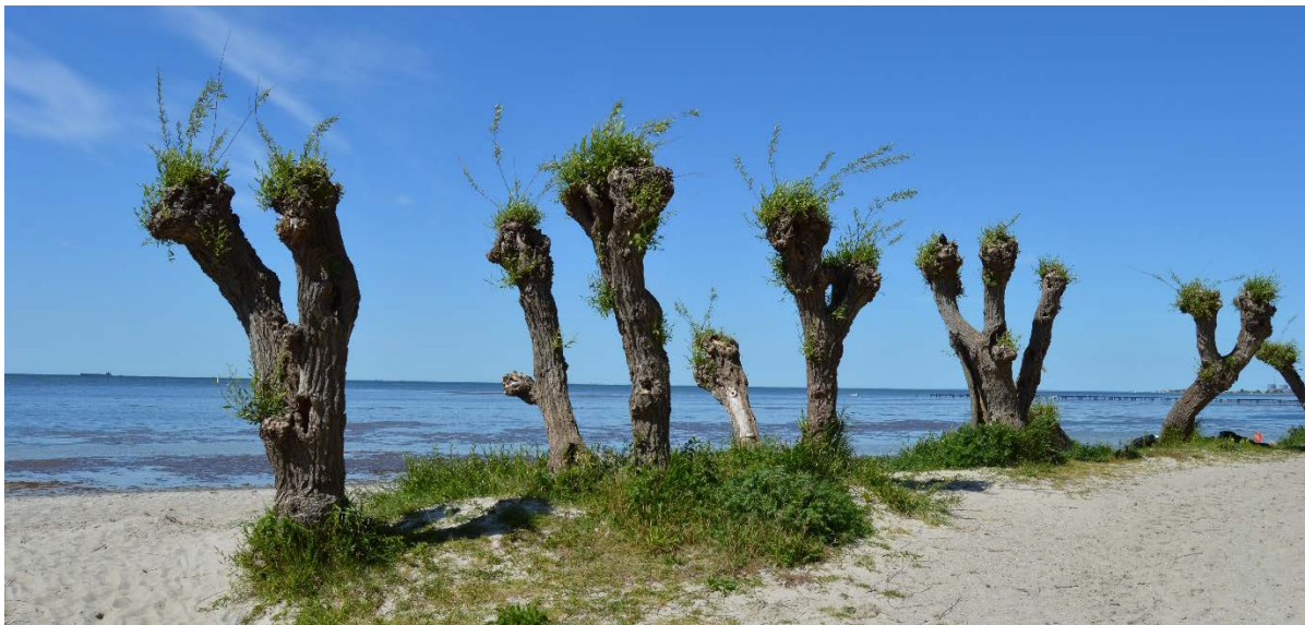
Vitpil på stranden vid Bjärred saltsjöbad