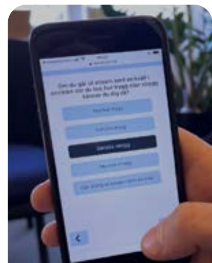
Trygghetsundersökning via sms