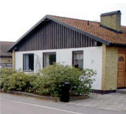
Gavelspetsen är ofta klädd med träpanel. Enluftsfönster eller fönsterband.