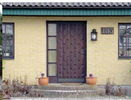
Dörrar med sidoljus.