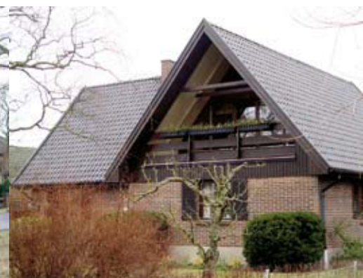
Indragna balkonger blev populärt på 1970-talet.