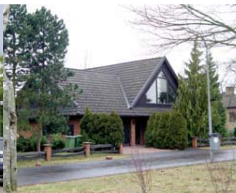
1½-planshusen har ibland upp-glasade gavlar.