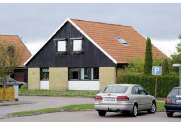
På 1970-talet blev det vanligt med 1½-planshus.

1968 ändrades reglerna för statliga bolån. Tidigare fick lägenhetsytan, inklusive inredningsbar vind, inte överstiga 125 kvadratmeter. Nu togs den övre ytgränsen bort. Under 1970-talet ökade därför storleken på småhusen betydligt. En annan påtaglig förändring i förhållande till 1960-talet var att småhusbebyggelsen fick större formrikedom samt fler typer av fasadmateriäl, som brunt och vitt tegel.