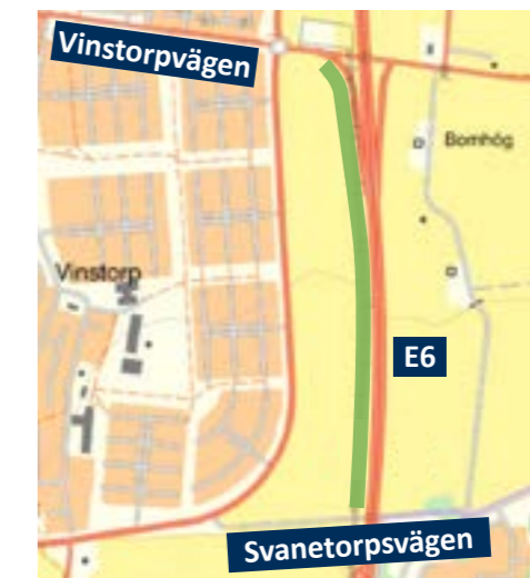
Tänkt sträckning är markerad i grönt.

Lomma kommun äger inte området norr om Vinstorpsvägen. Marken är privat och för att denna sträcka ska kunna få bullerskydd krävs att Trafikverket tar fram en vägplan för bullerplank. Trafikverket kan med hjälp av planen sedan tvångsvis ta marken i anspråk. Besked om detta kommer tidigast 2021, när Trafikverket redovisar sin utredning kring en eventuell utbyggnad av E6.