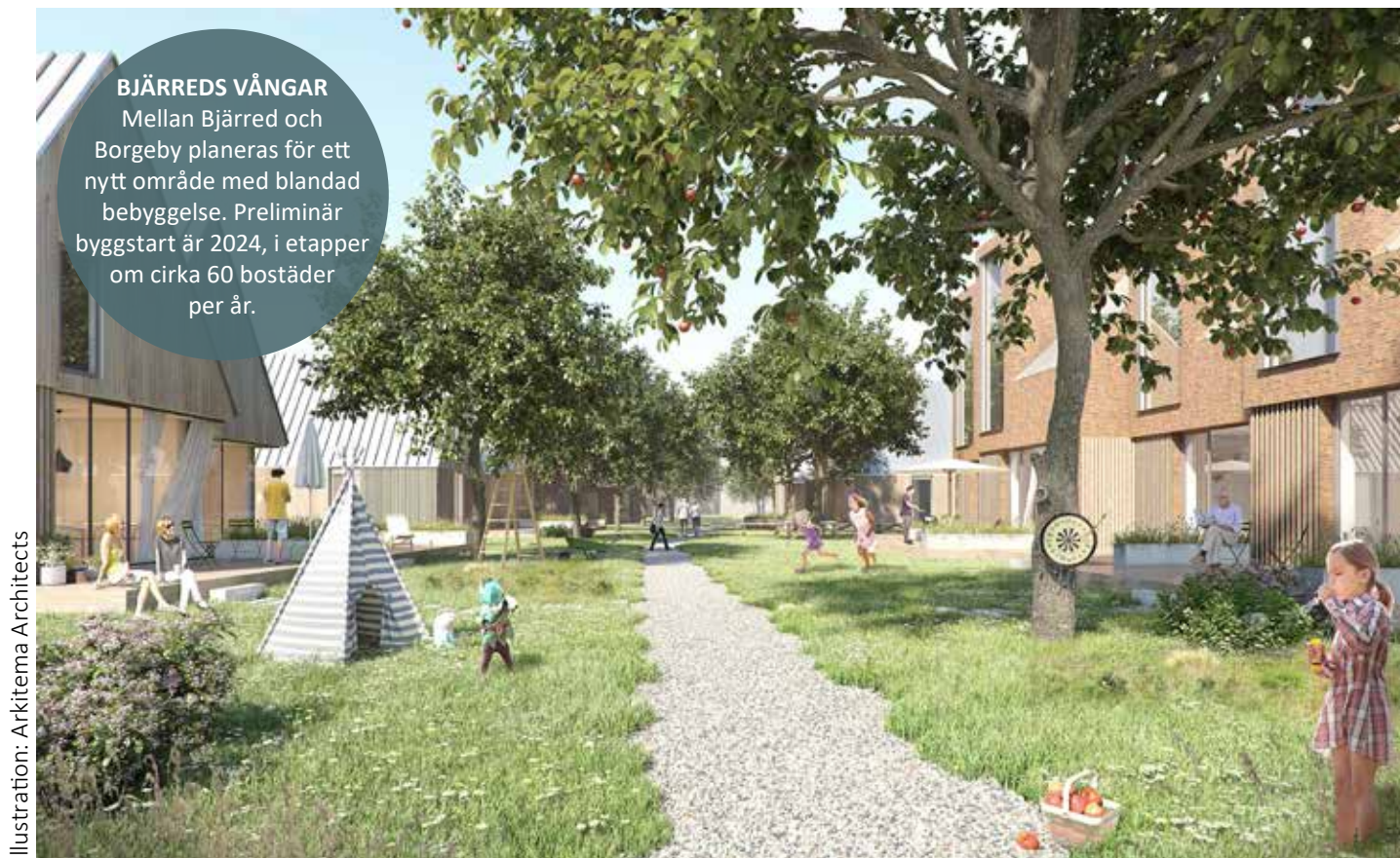
Illustration: Arkitema Architects

BJÆRREDS VÅNGAR Mellan Bjærred och Borgeby planeras för ett nytt område med blandad bebyggelse. Preliminär byggstart är 2024, i etapper om cirka 60 bostäder per år.