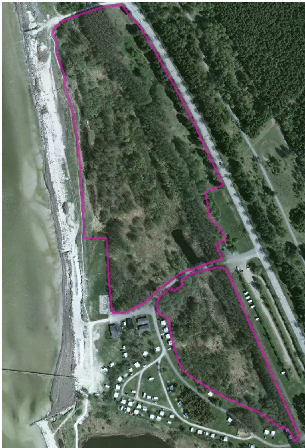
Alkärret i Haboljung, naturreservatets avgränsning