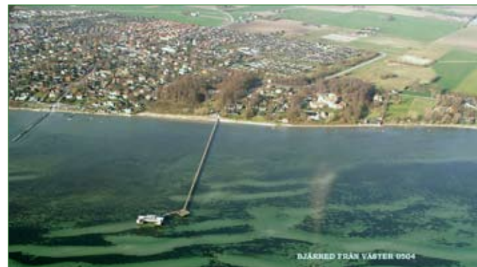
...och i dag ser det ut så här.