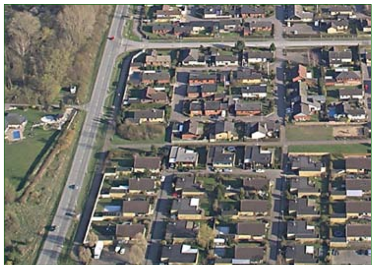
Men visst har det hänt saker sedan 1769. I dag ser Bjärred ut så här en vacker försommardag.