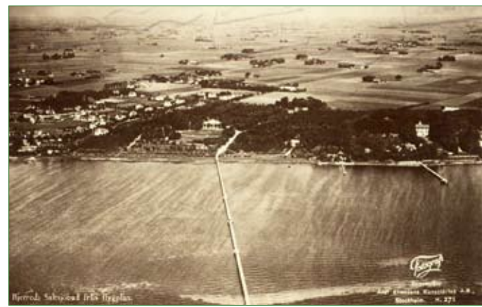
Så här såg Bjärred ut från Öresund när 1900-talet var mycket ungt...

Promenadvägen som beskrivs går genom Bjärreds norra del och Lödösnäs, områden som i huvudsak är belägna i Borgeby socken. Det som i dag generellt kallas Bjärred ligger egentligen i, från norr räknat, Borgebys, Flädies och Önnerups socknar. Nya Bjärred är delen mellan Näktergalsvägen - Kamrersvägen - Leifs väg till och med Bjersund och den mindre delen söder därom är Gamla Bjärred. "Flaggorna" på kartan visar till texten nedan. Hela rundvandringen är cirka 6,5 km. Känns hela stigen för lång att gå vid ett tillfälle kan man dela upp den, exempelvis i två etapper genom att korsa vid cykelvägen Scoutgården - Lödöesskolan. Under 2009 och 2010 kan slingan utmed Anna Sömmerskas väg vara blockerad av byggnadsarbeten. Ta annan väg förbi.