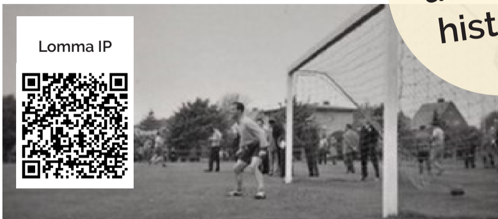
Tennisbanorna i Bjärred