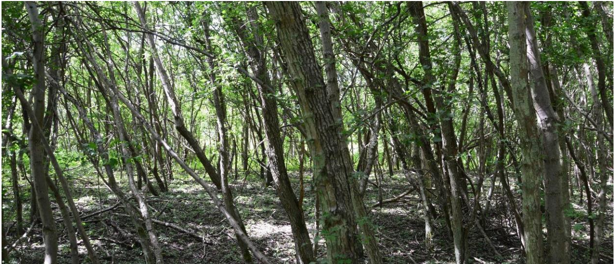
Figur 6 Blandlövs skogen i område 1d domineras bitvis helt av hagtorn.

Fältvegetationen består av brännässlor, kirskaål, blekbalsamin, lundgröe och husmossa. Flera exemplar av vanlig groda noterades inom objektet. Hagtorn tillsammans med oxel är bärgivande buskar/träd vilket är positivt för fågellivet. Relativt hög förekomst av vanlig groda beror troligen på att det täta trädskiktet skapar en fuktig miljö samt en gles markvegetation som är framkomlig för groddjur.