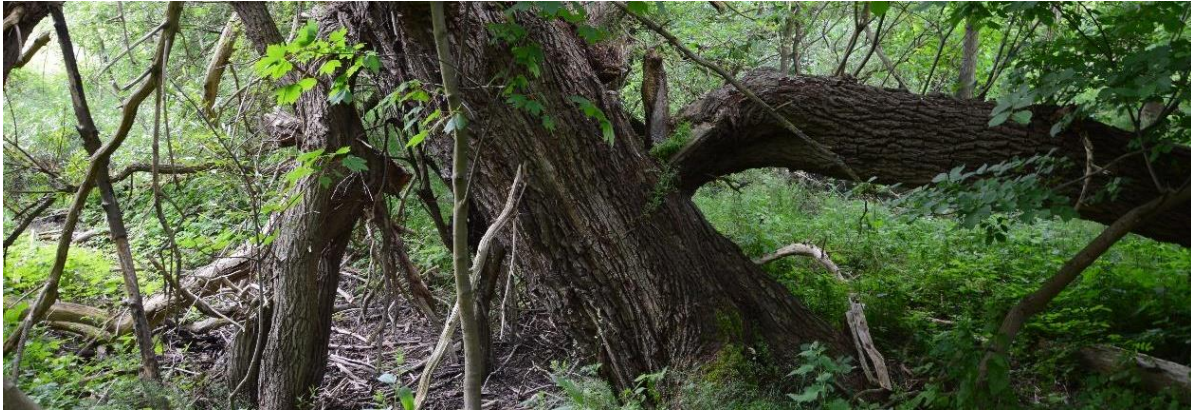
Figur 3 Skötselområde 1a. En gammal vitpil med grova grenbrott och ihålligheter, ett av flera äldre större träd som bör få utvecklas och vårdas.

Området utgörs av en lövträdsmiljö med stor åldersvariation vilket bidrar till de högsta skogliga naturvärdena inom reservatet. En jämn förekomst finns av gamla träd som vitpil, hästkastanj, ask, sälg och svarttall samt i söder grova hasselbuskar. Det finns även flera gamla hagtornsträd. Allmän förekomst finns av död ved, både klen men även mycket grov, främst alm. Ett småvatten förekommer med mindre vattensalamander. Även vanlig groda förekommer i området. Dominerande arter i fåltskiktet i den slutna miljön är lundgröe, klättervildvin, brännässlor, snärjmåra, hundäxing och hallon. I de mer öppna gläntorna finns arter som bladvass, gulvial, luddtåtel, sötväppling och kanadensiskt gullris. Även svart vinbär förekommer inom området. Förekommande vedsvampar är plommonticka, fjällticka, sköldskivling, judasöron och signalarten rostticka.