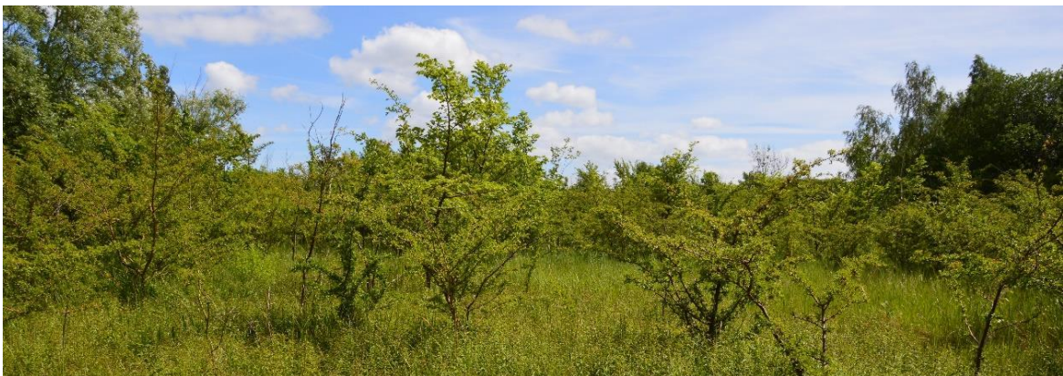
Figur 10 Inom skötselområde 2a finns den sällsynta vegetationstypen kalkfuktäng. På bilden ses täta bestånd med krissla.

Området är en igenväxande fuktäng av kalkfuktängstyp som dock ännu är relativt solbelyst. Framträdande är högvuxna arter som bladvass, bergör, piggstarr och luddtåtel. Men det finns även partier med en rikblommande ängsflora bestående av arter som prästkrage, kråkvicker, käringtand, sötväppling, revfingerört, majnycklar och ängsnycklar. Därtill finns täta bestånd av krissla. Skogsalm och hagtorn dominerar träd- och buskskiktet. Biotopvärdet är kopplat till en kalkgynnad och rikblommig ängsflora, med betydelse för pollinerande insekter. Noterat artvärde består av orkidéerna majnycklar och ängsnycklar. Hybrider mellan arterna finns troligen också i området. Både biotop- och artvärdet skulle öka om anpassad hävd infördes i objektet. Naturvårdsarter är majnycklar, ängsnycklar, krissla och lundalm.