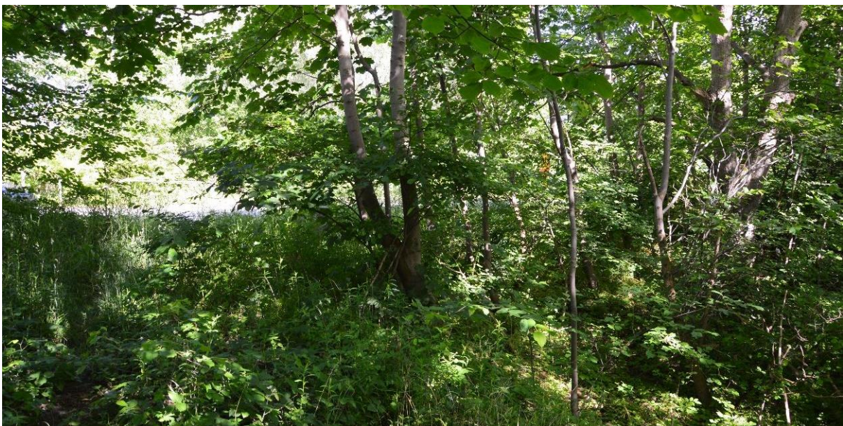
Figur 5 Yngre blandlövskog med uppväxande buskar och sly i skötselområde 1c.

Området består av yngre blandlövskog av örtrik typ som växer norr om de större dammarna samt även mellan dessa. Trädskiktet är relativt tätt och innehåller bland annat vårtbjörk, sälg, lönn och skogsalm. Bitvis finns allmän förekomst av klen död ved. I undervegetationen växer kirskaal, hundäxing och björnbär. I området norr om dammarna förekommer en del skrot och rester efter byggnadskonstruktioner. Områdets biotopvärde består främst av bitvis allmän förekomst av död ved, som till stor del utgörs av klena stammar och grenar liggande på marken. I skötselområdet ingår även en avverkad yta vid en tomt mellan de båda dammarna, som har nykoloniserad mark med arter som blomsterlupin, baldersbrå och kanadensiskt gullris.