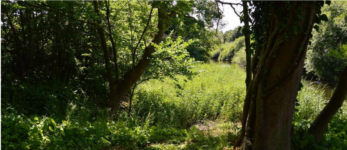
Figur 4 Del av lövbården mot Höje å samt område med bladvass i strandzonen (skötselområde 1b).

Områdets biotopvärde är främst kopplat till förekomsten av död ved. Viktigt är också att trädridan fungerar som en skyddszon mot ån, vilket är positivt för naturvärden knutna till vattendraget. Närvaron av invasiva arter som kanadensiskt gullris och blomsterlupin sänker värdet något.