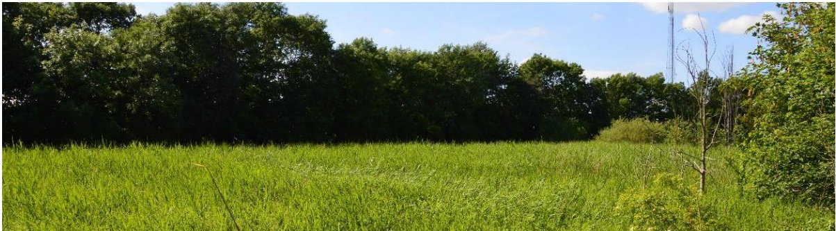
Figur 15 Det flacka vassområdet i skötselområde 5 bildar ett naturligt svämplan för Höje å.

Ingen särskild skötsel finns för objektet. Det viktiga är att miljön inte påverkas av exploateringar eller andra åtgärder. Området bör regelbundet inventeras på intressanta växt- och djurarter och naturvårdsåtgärder för att gynna dessa bör utföras. Området kan utredas för lämpligheten att skapa lekplatser för gädda.