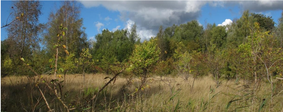
Figur 9 Inom skötselområde 2a finns den sällsynta vegetationstypen kalkfuktäng med bestånd av bland annat orkidéerna maj- och ängsnycklar. På bilden ses bestånd med bladvass.

Området är en igenväxande fuktäng av kalkfuktängstyp som dock ännu är relativt solbelyst. Framträdande är högvuxna arter som bladvass, bergör, piggstarr och luddtåtel. Men det finns även partier med en rikblommande ängsflora bestående av arter som prästkrage, kråkvicker, käringtand, sötväppling, revfingerört, majnycklar och ängsnycklar. Därtill finns täta bestånd av krissla. Skogsalm och hagtorn dominerar träd- och buskskiktet. Biotopvärdet är kopplat till en kalkgynnad och rikblommig ängsflora, med betydelse för pollinerande insekter. Noterat artvärde består av orkidéerna majnycklar och ängsnycklar. Hybrider mellan arterna finns troligen också i området. Både biotop- och artvärdet skulle öka om anpassad hävd infördes i objektet. Naturvårdsarter är majnycklar, ängsnycklar, krissla och lundalm.