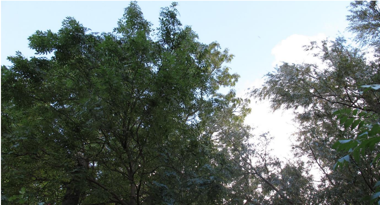
Figur 8 Äldre ask i norra delen av skötselområde 1e.

av skuggning. Biotopvärdet är främst kopplat till ett varierat trädsnitt med förekomst av bärgivande träd samt grova träd i form av vitpilar. Miljön har även ett värde i att det bildar en skyddande kantzon för närliggande mindre dammar samt även för Höje å och dess svämzon.