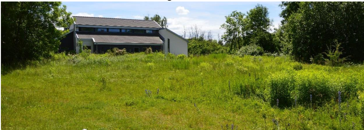
Figur 12 Torräng av knylhavreängstyp med kanadensiskt gullris samt förekomst av lågvuxna örter.

Området är en torräng av knylhavreängstyp och utgörs av öppna gräsmarker utan hävd (eller med svag hävd) och domineras främst av högvuxna arter som johannesört, hundäxing, bergsrör, färgreseda och kanadensiskt gullris. Även blommande små till medelörter förekommer såsom vitklöver, humlelusern, stånds, blåeld, harklöver, duvvicker och grönfibbla. Biotopvärdet är främst kopplat till de blommande örterna som är värdefulla för flera insekter.