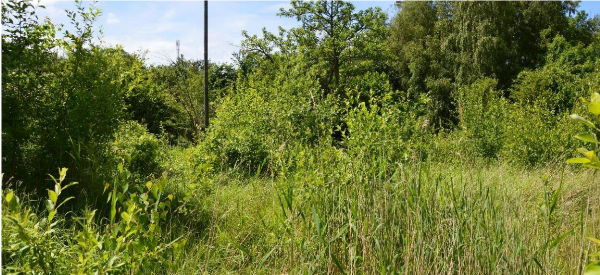
Figur 11 Fuktäng av högörtstyp i skötselområde 2b med bland annat bladvass och en pågående igenväxning.

Området som tidigare varit bostadstomt är nu en fuktäng av högörtstyp som domineras av högvuxna arter som bergrör, strandiris, kanadensiskt gullris, bladvass, knylhavre, brännässla, älgört, kråkvicker, åkertistel, blomsterlupin och astilbe. Det finns dock små ytor med kortare vegetation bevuxna av arter som gråfibbla, harklöver och revfingerört. Den pågående igenväxningen av björk, hagtorn, sälj och tysklönn är påtaglig. Området är under igenväxning och kommer att övergå till en sluten busk- och trädmiljö om åtgärder inte vidtas. Biotopvärdet är kopplat till blommande örter som är värdefulla för flera insekter. Objektet har även utvecklade brynmiljöer som skapar varierade strukturer med betydelse för både insekter och fåglar. Problem finns dock i förekomsten av den invasiva arten blomsterlupin som kan ta över stora områden och konkurrera ut inhemska arter.