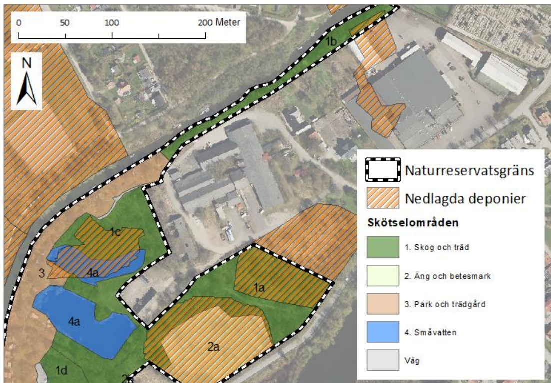
Figur 1 Nedlagda deponier i och omkring naturreservat Pråmlyckan. Skötselområden finns med som referens, se figur 2 för detaljer om dessa.

Bedömning av riskerna med avfall i området visar olika risknivåer och att försiktighetsprincipen bör tillämpas. Det innebär att känslig verksamhet i området inte bör förekomma på, eller precis intill, deponiområdena på fastigheterna Lomma 22:11, Lomma 22:12, Lomma 22:13 och Lomma 22:5. En kompletterande MIFO-undersökning (Metodik för Inventering av Förorenade Områden) tilldelade Pråmlyckan en riskklass 3 – måttlig risk (Falk 2009). Tegelbruk har som bransch tilldelats riskklass fyra – liten risk i Naturvårdsverkets branschkartläggning (BKL), men i detta fall tilldelas området en strängare riskklass med anledning av dess stora skyddsvärde och mycket stora känslighet. Föroreningarnas farlighet och områdets spridningsförutsättningar bedöms som måttliga. Deponierna inom området ligger främst inom skötselområde 2a, i område 1c norr om dammen samt i norra delarna av 1a (figur 1).