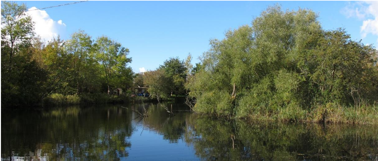
Figur 13 Den norra dammen i skötselområde 4a med högre andel död ved jämfört med södra dammen.

Området består av två grävda dammar med liknande vegetation. Den norra dammen har större utbredning av vårtsärv och vattnet är betydligt klarare. Det finns även betydligt mer död ved här, vilken används som jaktmark för kungsfiskare. Dammarna förbinds via ett djupt dike. Övrig vegetation i kanterna är bladvass, bredkaveldun, vecketåg, tiggarranunkel, älgört, strandklo och luddunört. I vattnet finns även andmat och korsandmat. Rikligt med fisk finns i dammarna. Sothöna häckar i båda dammarna, och grågås häckar i den södra dammen. Gråhakedopping har tidigare noterats som häckande. Naturvårdsarter är kungsfiskare, vårtsärv, snok och vanlig groda. Biotopvärdena är kopplade till den döda veden i vattnet samt de öppna vattenytorna. Det klara vattnet i den norra dammen är även positivt för födosökande kungsfiskare.