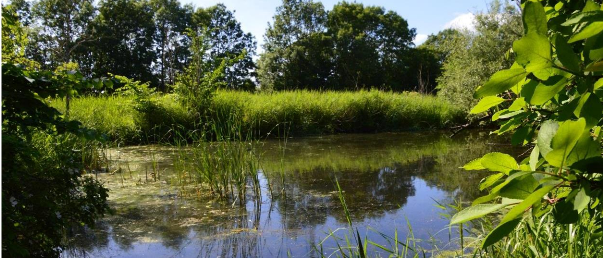
Figur 14 Småvatten i skötselområde 4b som omgärdas av uppvuxen bladvass samt videbuskage och lövträd.

Området utgörs av två grävda smådammar vilka omges av bladvass, nära Höje å. Vattenskräppa och vattenmärke finns inom området. Sothöna häckar i området och sjungande fåglar som rörsångare kan höras från vassen. Biotopvärdet ligger i förekomsten av småvatten som omges av tät vegetation i form av bladvass och till viss del lövträd. Miljön är värdefull för fågelfaunan.