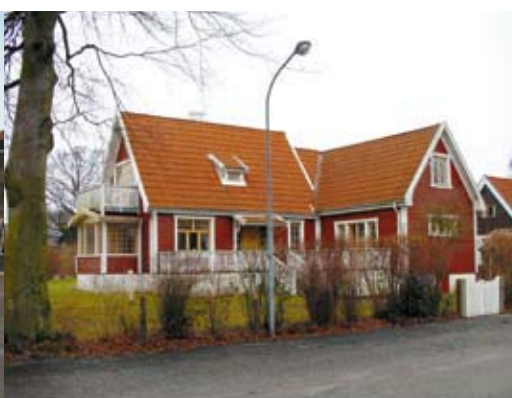
Ett lyckat exempel på en tillbyggnad som har anpassats till den ursprungliga byggnaden.