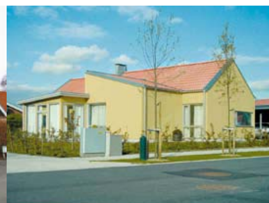
Ingen eller en lätt utskjutande takfot är ett sätt att anknyta till en lokal byggnadstradition.