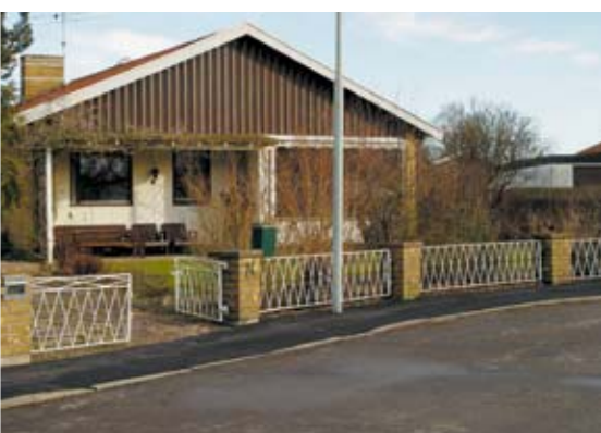
Staket ska harmoniera med byggnadernas fasader.