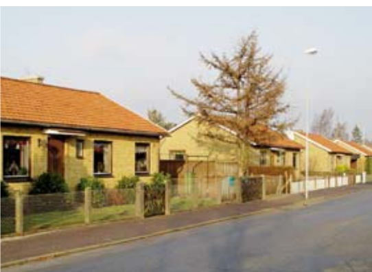
Den enhetliga utformningen skapar en sammanhållen gatubild.