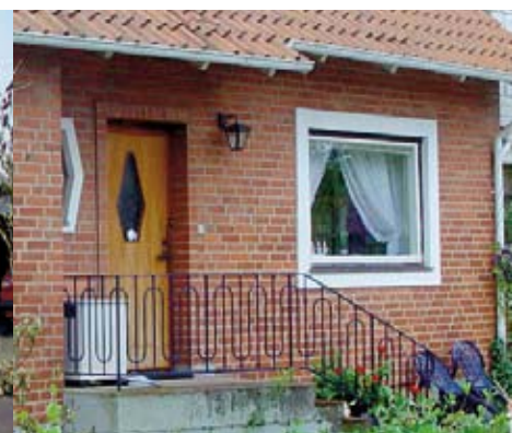
Dörrar med sidofönster eller infällda fönster.