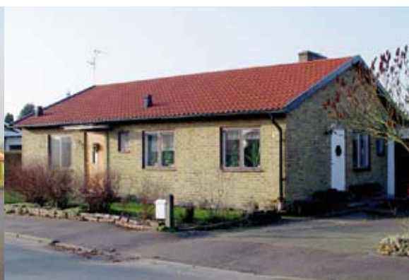
Enkla skärmtak ovan entrédörrar.