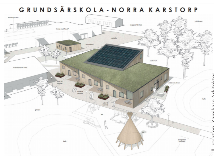
Illustration: Kamikaze Arkitekter

Skolan ska ge barn med särskilda behov en utbildning som så långt som möjligt motsvarar den som ges i grundskolan, med undervisning som anpassas efter elevernas egna förutsättningar. Eleverna får även gå på en skola i närheten där de växer upp, med en större kännedom om sin närmiljö och kan träna sig i att bli självständiga på hemmaplan.